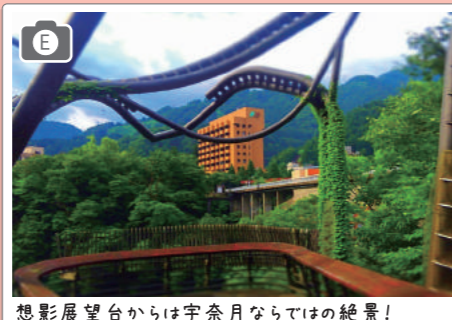
想影展望台からは宇奈月ならではの絶景!

おもかげコースはゆったりと温泉街の旅情に触れるまち歩き。足湯やスイーツを楽しみながら、日本文学や芸術の世界にも繋がれるかも。