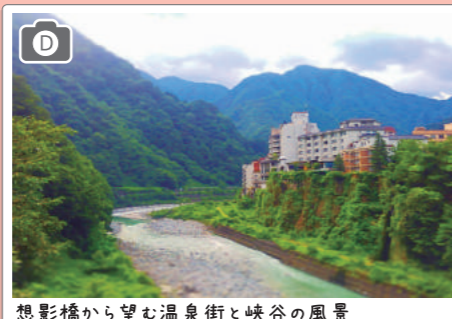
想影橋から望む温泉街と峡谷の風景