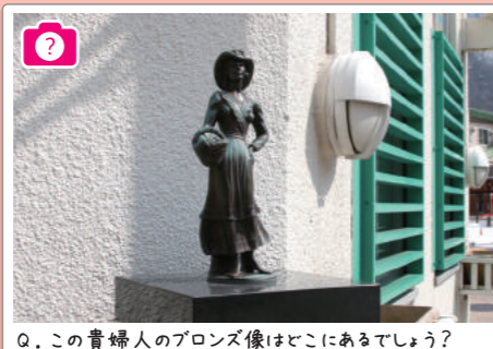
Q.この貴婦人のブロンズ像はどこにあるでしょう?