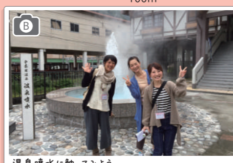
温泉噴水に触ってみよう