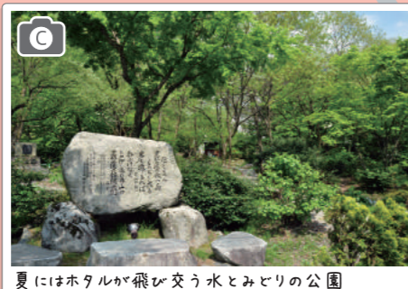
夏にはホテルが飛び交う水とみどりの公園