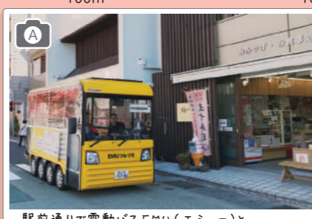
駅前通りで電動バスEMU(エミュ)と

エンリック・ミラーレスってどんな建築家？ 想影展望台を設計したエンリック・ミラーレスは現代のガウディと讃えられたスペインの建築家。遺作となったバルセロナのサンタ・カテリーナ市場の再生やディアゴナル・マル公園などを手がけました。⑥