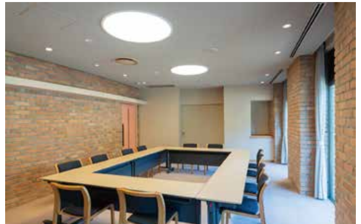
会議室C スクール型20名